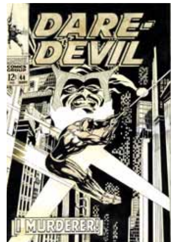
Daredevil, Gene Colan, 1968