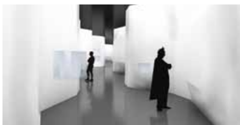
Scénographie de l'exposition © Projectiles

Au total 150 auteurs internationaux et 350 œuvres contribuent à cette exposition qui veut également proposer un éclairage sur la période actuelle où la bande dessinée franchit de nouvelles frontières en matière de création, avec des auteurs de bande dessinée proches de l'art contemporain, comme Jochen Gerner, Ilan Manouach, Dominique Goblet, Thierry Van Hasselt, Christopher Hittinger.