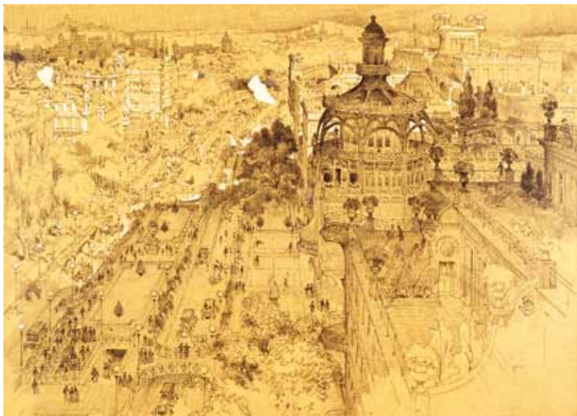
Dessin Louis Bonnier © IFA / Centre d'archives d'architecture du XX e siècle

CITÉ DE L'ARCHITECTURE & DU PATRIMOINE – PALAIS DE CHAILLOT 1 PLACE DU TROCADÉRO – PARIS 16 e (M o IÉNA OU TROCADÉRO)