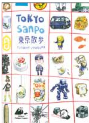
1. Plan de Paris © Armelle Caron 2. Couverture du livre "Tokyo Sanpo" © Florent Chavouet